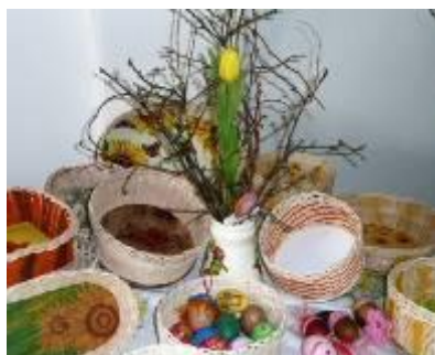
Velikonoční výstava (Jindř. Hradec)