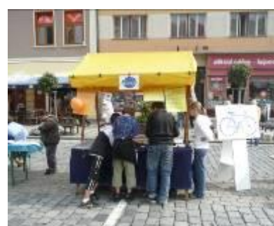
Evropský týden mobility (Písek)