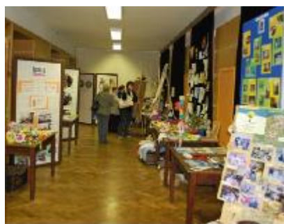
30 dní neziskového sektoru (Vimperk)