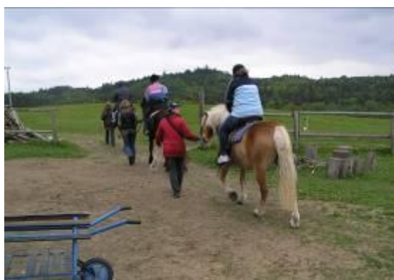
výlet na koně - ranč Ixion (Chrastiny)

Všedobr - volnočasové aktivity pro osoby se zdravotním postižením z řad uživatelů ostatních služeb organizace MESADA, občanské sdružení případně v omezeném počtu pro zájemce „z venku“. V roce 2009 proběhlo 13 Všedobrů na různá témata: Vernisáž bienále kresleného humoru ve Sladovně v Písku, výroba vánočních přání, malování na obláčky, malování na hedvábí, minigolf na Ostrově v Písku, výlet na koně na ranč IXION v Chrastinách, výroba velikonoční dekorace, výroba jarní dekorace, posezení v písecké čajovně, výstava ve Sladovně v Písku, bowling, oslava svátku jednoho z účastníků Všedobru, vánoční akademie ZŠ Svobodná, vánoční posezení.