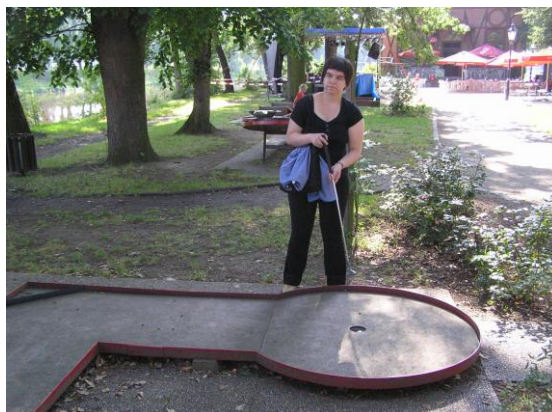
minigolf na Ostrově v Písku