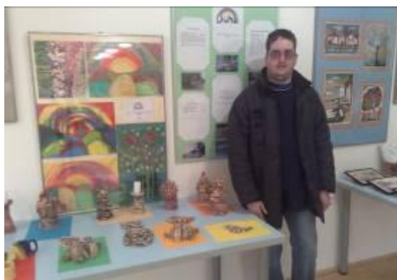
výstava ve Sladovně v Písku